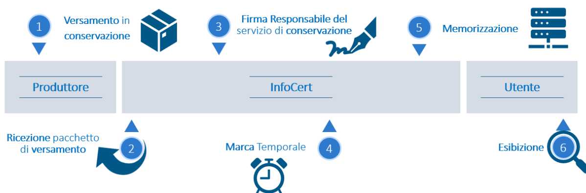
Figura 1 disegno di processo

Il processo può essere così schematizzato: